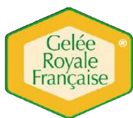
Groupement des Producteurs de Gelée Royale

Les conditions d'attribution du droit d'usage, de suivi et d'utilisation de la marque sont consignées dans le règlement d'usage de la marque déposé au registre national des marques.